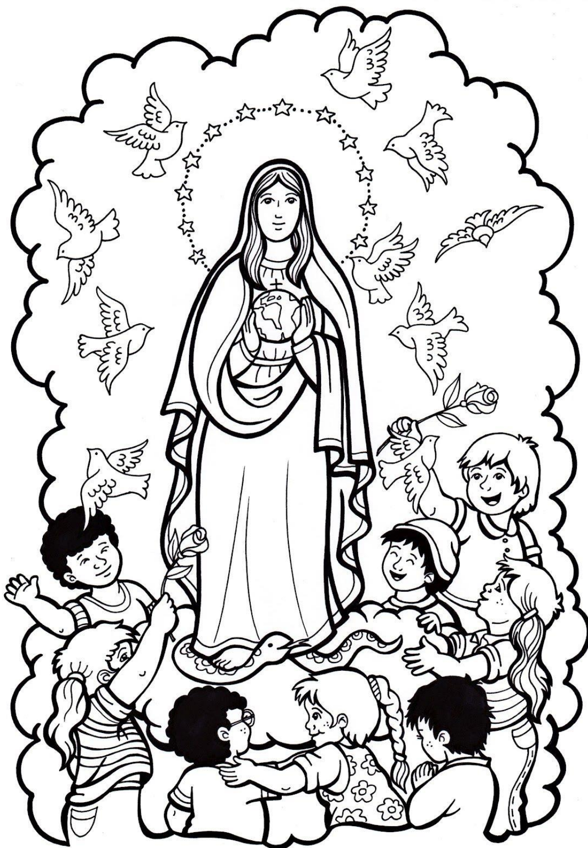
Rys. Kolorowanka „Maryja naszą matką”.